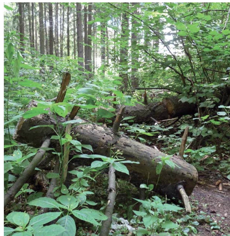
Предприниматель утверждает, что вырубка леса будет минимальной