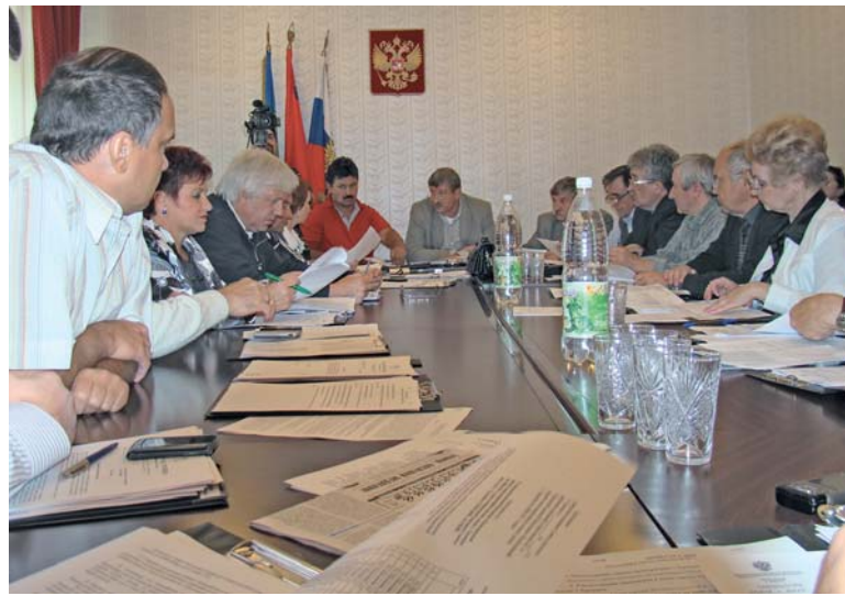
27 августа 2009 года. После летних каникул депутаты собрались на первое заседание

ственного видения предложенной им схемы городского управления и хозяйствования.