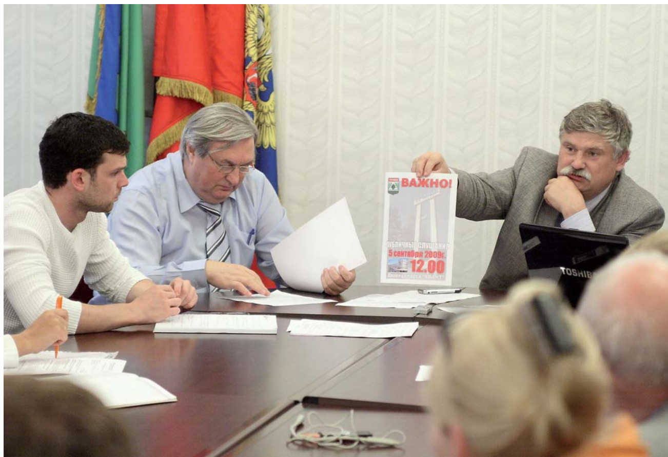
Варианты текста объявления о публичных слушаниях предлагались разные